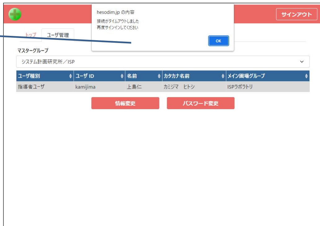
画面8 接続タイムアウトの確認ダイアログ